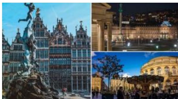
4 - Stuttgart, Rennes, Antwerp

Anogir ymgeiswyr i drafod eu cynigion gyda Thîm Horizon Europe cyn eu cyflwyno (ebost: HorizonEurope@llyw.cymru ). Efallai y bydd cyllid SCoRE Cymru hefyd ar gael ar gyfer ceisiadau nad ydynt yn cyd-fynd â nodau'r fenter hon