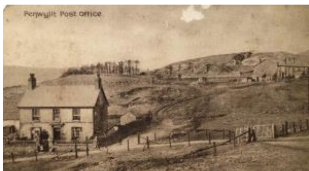
1 - O gasgliad Archifau Powys. Rhif Catalog. B/X/136/P/9

Am ragor o ddelweddau hanesyddol a ffeithiau diddorol ym Mhowys, dilynwch Archi fau Powys ar Facebook, Twitter neu Instagram.