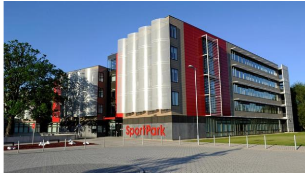
3 - SportPark, Loughborough.

Erbyn hyn, rwy'n rhan o dîm Canolbarth Cymru, ac rwy'n edrych ymlaen yn fawr i weld y prosiectau o fewn y Fargen Dwf yn dod yn fyw. Mae cyfnod cyffrous o'n blaenau!