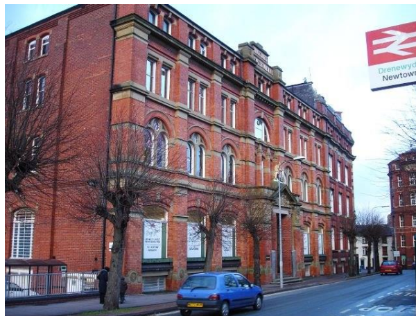
4 - Warws Brenhinol Cymreig, Drenewydd.